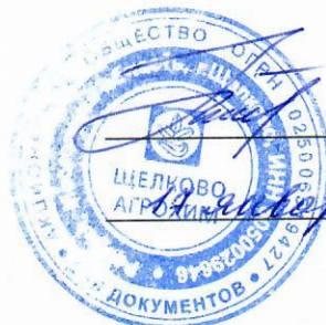
ГРАФИК ПРОВЕДЕНИЯ АНАЛИЗОВ ВОЗДУШНОЙ СРЕДЫ В САНИТАРНО-ЗАЩИТНОЙ ЗОНЕ АО «ЩЕЛКОВО АГРОХИМ» на 2020г.